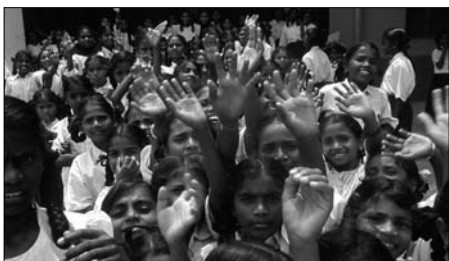
VOOR DE MEISJES VAN KOSTSCHOOL WIL FUTURE FOR SALE EEN ADOPTIEPROJECT STARTEN

Ook Femke Halsema, fractievoorzitter van Groen-Links in de Tweede Kamer, heeft Karunalaya en de opvangkampen voor de tsunamislachtoffers in Chennai bezocht. Zij heeft aangeboden haar naam te verbinden aan de wederopbouwprojecten van Karunalaya en Amaidhi na de tsunami.