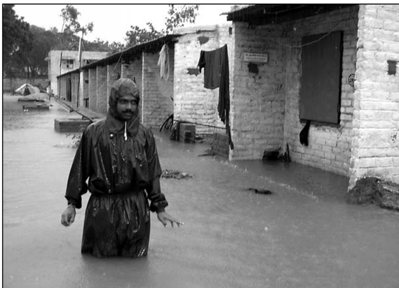
EEN MEDEWERKER VAN KARUNALAYA IN HET OPVANGKAMP VOOR GETROFFENEN DOOR DE TSUNAMI

Amaidhi heeft vanaf de dag na de tsunami actie gevoerd voor Karunalaya, dat haar werkgebied midden in de zwaar getroffen vissersgemeenschap van Noord-Chennai heeft. Dit resulteerde tot onze eigen verrassing in een opbrengst van 88.439 euro. Een geweldig resultaat waarvoor we alle - veelal onbekende - donateurs hartelijk bedanken.