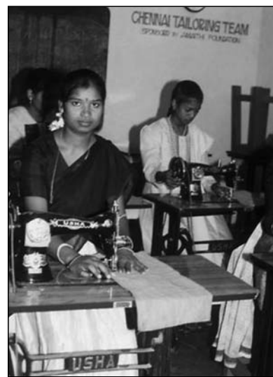
HET PROJECT CHENNAI TAILORING TEAM WORDT FINANCIEEL AFGESLOTEN.

De klermaakstersopleiding Chennai Tailoring Team functioneerde in 2005 en 2006 zonder een bijdrage van Amaidhi. Door een moeizame communicatie met het project waren we onvoldoende op de hoogte van de stand van zaken. Die bleek tijdens het eerder genoemde projectbezoek gelukkig veel positiever dan gevreesd.