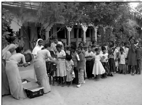
OP HET TERREIN VAN ST. THOMAS HOSPITAL WORDEN SCHOOLTASSEN MET INHOUD UITGEDEELD.

we op eigen kracht een kleine 11.000 euro binnen. Wilde Ganzen en NCDO ondersteunden dit deel van het project niet omdat het hier om jaarlijks terugkerende kosten gaat.