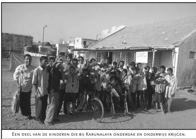
EEN DEEL VAN DE KINDEREN DIE BIJ KARUNALAYA ONDERDAK EN ONDERWIJS KRIJGEN.