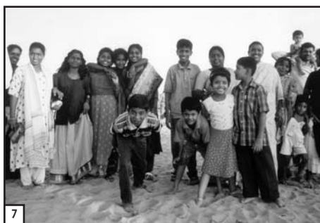
7 DE VROUWEN VAN HET CHENNAI TAILORING TEAM EN HUN KINDEREN OP HET STRAND BIJ MAHABALIPURAM.

Ook met de meisjes en vrouwen van het Tailoring Team zijn we een dag eropuit getrok-